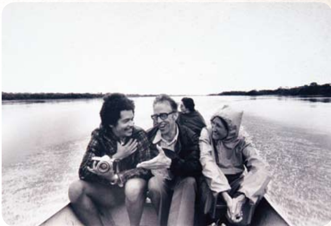
Com D. Pedro Casaldáliga, bispo de São Félix do Araguaia, e a repórter Ângela Zirolto. Foto feita no Mato Grosso, em 1976, ano em que o bispo sofreu uma séria ameaça de morte.